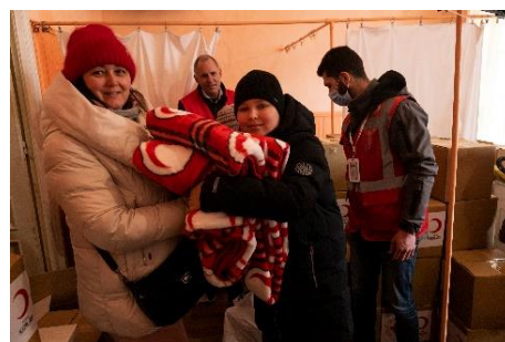
Røde Kors uddeler vinterhjælp med støtte fra Venskabsprojektet.

Midlerne skal blandt andet bruges til at sikre, at udsatte grupper er i stand til at opfylde deres basale behov og er i stand til at holde varmen i de kommende vintersæsoner fx ved uddeling af tæpper. Aktiviteterne vil også omfatte levering af vigtig og livreddende nødhjælp og støtte samt kontante tilskud til familier, der huser internt fordrevne, så de kan fortsætte med at betale deres varmeregninger og sørge for de mennesker, de er vært for. Aktiviteterne vil også omfatte forbedring af forholdene i offentlige kollektive centre, herunder udførelse af lettere reparationer.