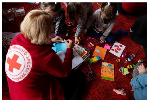
Røde Kors giver psykosocial støtte til børn berørt af krigen.