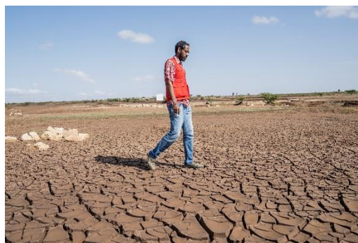
Klimaforandringer er mærkbare i Etiopien.