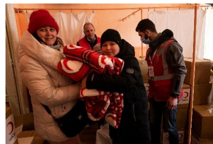
Røde Kors uddeler vinterhjælp med støtte fra Venskabsprojektet.

Endelig vil midlerne også blive brugt til at støtte Ukrainisk Røde Kors i deres evne til at opskalere markant gennem rekruttering, uddannelse og fastholdelse af de mange nye frivillige, der er nødvendige for deres massive indsats, der finder sted nu og i de kommende år.